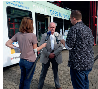
Unser Vorsitzender im Interview mit Radio Regenbogen und Baden FM.

Vorgestellt wurde die Kampagne im Rahmen einer Pressekonferenz am 14. September bei der VAG Freiburg. Seitdem sind eine Straßenbahn und drei Busse mit den Kampagnenmotiven im Auftrag der Verkehrssicherheit unterwegs. Weitere Infos unter: www.wirgeben8.com