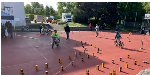
Mit dem Fahrrad sicher Kurven fahren, ausweichen und bremsen: Am 23. September hat der Motorsportsportclub Comet Durmersheim gemeinsam mit der Sport- und Verkehrsabteilung des ADAC Südbaden im Rahmen des Schulsportfestes „Badenova bewegt“ in Offenburg ein Fahrradturnier veranstaltet. In einem Parcours mit sieben Stationen konnten 176 Schülerinnen und Schüler ihre Fähigkeiten auf dem Fahrrad austesten und das richtige Verhalten mit dem Rad spielerisch üben.