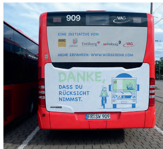
Die Heckklappe von drei VAG-Bussen wurde ebenfalls mit den Kampagnen-Motiven gestaltet.