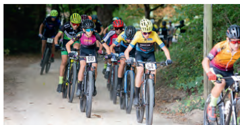
Jede Menge Spaß hatten die Kinder und Jugendlichen beim Heimrennen, viele schnupperten zum ersten Mal Rennluft.

Das Mountainbike-Heimrennen unseres Ortsclubs RMSV „Edeltanne“ Ehrenkirchen am 25. Juli 2022 im Rahmen des Schwarzwälder MTB Cups war ein voller Erfolg: Am Start waren knapp über 200 Teilnehmende sowie mehr als 40 „Powerflitzer“ unter 7 Jahren. Rund 1.000 Zuschauer waren vor Ort und erlebten einen großartigen Tag mit spannenden Rennen und leckerer Verpflegung.