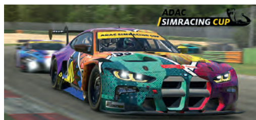
Im Finale der Sommer Saison hatten die südbadischen Fahrer die Nase vorn.

4. Platz: Kevin Koller – MSC Hornisgrinde