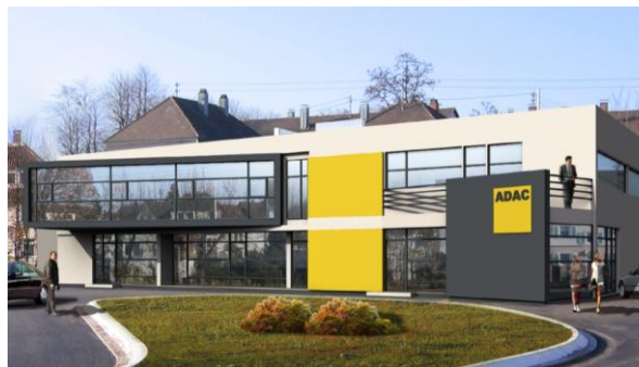
Die ADAC Geschäftsstelle in Baden-Baden.

Markenpräsenz in der Fläche zeigen und die sechs südbadischen Standorte stärken – so lautet das Mitgliederservice-Ziel für die Zukunft. Mit dem Teil-Erwerb des Gebäudes, in dem die ADAC Geschäftsstelle in Baden-Baden untergebracht ist, hat der ADAC Südbaden die Weichen für noch mehr ökonomische Stabilität und Sicherheit gelegt. Darüber hinaus wird die Geschäftsstelle in Villingen voraussichtlich bis Mitte 2021 in neue Räumlichkeiten in der Nähe des Schwarzwald-Baar-Klinikums umziehen.